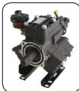
Bomba Kappa 43