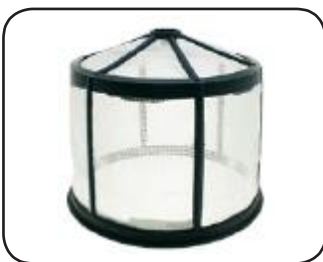
Coladera en la boca y tapa roscada con válvula check