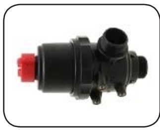
Filtro de admisión con check integrado