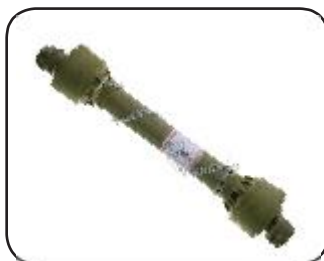
Eje Cardan Telescópico