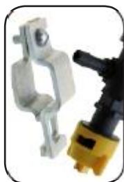
Porta boquillas en plástico de alta ingeniería, con antigoteo y tuerca de ataque rápido con punta de abanico plano