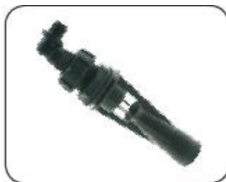
Agitador hidráulico tipo Venturi con injerto de cerámica